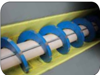
SINT™ Kendi kendini temizleyen drenaj