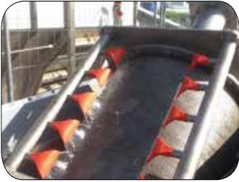
Temizleme nozulları ile döner tambur