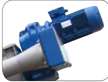
Tambur ve konveyör vidası için tek tahrik ünitesi